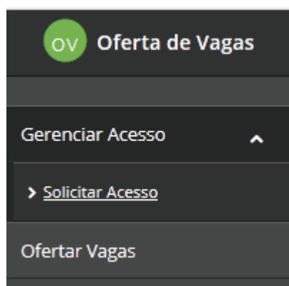
Figura 37 - Menu para o perfil "Colaborador"

Após o acesso ao sistema “Oferta de Vagas”, o usuário deverá acessar o item de menu “Solicitar Acesso”;